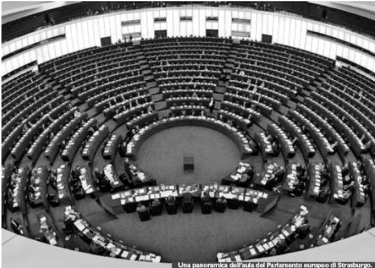
Una panoramica dell'aula del Parlamento europeo di Strasburgo.